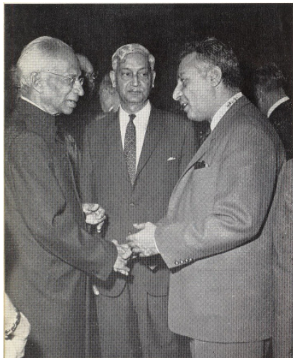
Der afghanische Botschafter bei den Vereinten Nationen, Exzellenz A. R. Pazhwak (r.) mit dem indischen Staatspräsidenten Dr. Radhakrishnan während dessen Besuch der Vereinten Nationen.

پانزدهمین سالگرد، اعلامیه عمومی حقوق بشر سازمان ملل متحد، بیانیه ایراد نموده است، که متن آن چنین است: «درست هزاران سال قبل، انسانها خود را با حق و اهمیت آن درگیر ساخته اند. اما مبارزه بخاطر حق در برابر بی عدالتی تا امروز، پیروزی کمی از خود نشان داده است. فقط در عصر نوین این مبارزه، امید بخش، بنظر می رسد، برسمیت شناختن این واقعیت را در عرصه بین المللی، اعلامیه حقوق بشر تأیید می نماید.»