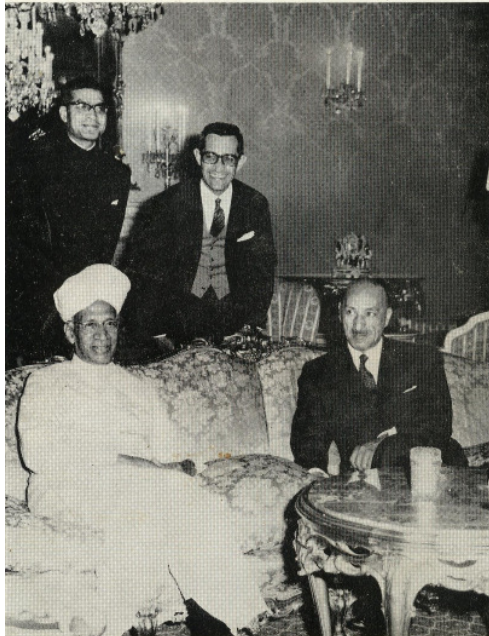
His Majesty King Mohammed Zahir Shah of Afghanistan with His Excellency President Dr. Radhakrishnan of India at the Gulshana Palace during the latter's State Visit to Kabul.

(در تصویر اعلیحضرت محمد ظاهر شاه پادشاه افغانستان در سمت راست نشسته، در پهلوی ایشان، رئیس جمهور هند، داکتر «رادا کرشنان»، سفرای دو کشور در پایتخت های همدیگر، در عقب ایستاده اند.)