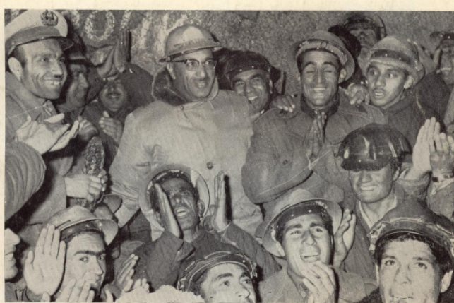
Seine Majestät der König (mit Brille) wird begeistert von den Männern des Arbeitskorps anlässlich des erfolgreichen Durchstoßens des Hindukusch-Gebirges zur Verbindung der beiden Teile des Salang-Tunnels begrüßt.

این نشریه که در آن مطلب فوق نشر شده است «افغانستان نیوز» بزبان انگلیسی نام داده شده است. این نشریه یا «بولتن» خبری، که در سال ۱۹۵۷م اساس گذاری گردیده است، از جانب سفارت «پادشاهی افغانستان» در لندن به چاپ می رسیده است و از مراکز عمده دیگر کشور های جهان، بشمول واشنگتن هم توزیع و محتوای آن بزبانهای مختلف نشر می شده است، که از جمله بعضی از شماره ها بطور پراکنده بزبان انگلیسی، فرانسوی و آلمانی بدست آمده است. این مطلب در شماره ۷۸ سال هفتم، یعنی در «فبروری» سال ۱۹۶۴م، در صفحه ۱۶ به چاپ رسیده است. درین سال دوران قریب ده سال صدارت سردارمحمد داوود خان، به پایان رسیده بود. بر اساس قانون اساسی جدید، این مقام دیگر نمی توانست توسط یک عضو خاندان «سلطنتی» اشغال شود. وقتی بر محتوای این شماره