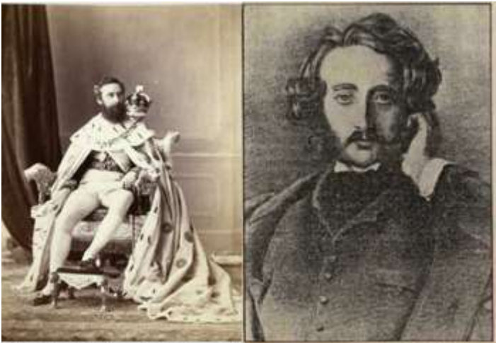
Edward Robert Bulwer-Lytton, 1. Earl of Lytton als Vizekönig von Indien ... die Briten gegen die Russen auszuspielen

نویسنده، به ادامه مطلب علاوه می کند که: " برتانوی ها با این صحبت مغرورانه پادشاه افغانستان، همزمان هم آرامش و هم احساس واهمه داشته است. از قریب تمام جوانب، "جواهر هندی"، از طریق سرحدات طبیعی محفوظ گردید..." ("شپینگل"، چهارشنبه، ۱۴ "دسمبر" ۱۹۵۵م، صفحات ۳۹ و ۴۰، شماره ۵۵)