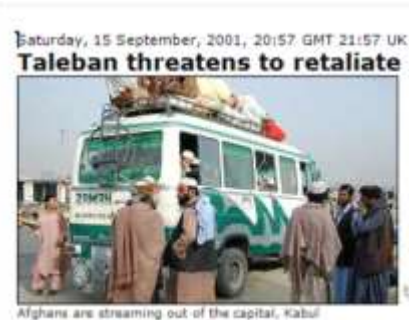
Afghans are streaming out of the capital, Kabul

سفیر "طالبان" در پاکستان در آنوقت، همین شخص که "ضعیف" می نامیدند، بر اساس گزارش "بی بی سی"، تاریخ ۱۵ سپتمبر ۲۰۰۱م، فقط چهار روز پس از حوادث "نیویارک" و واشنگتن، از خطر "جنگ تلافی جویانه" یاد آور شده است. این شخص که حد اکثر کنفرانس های مطبوعاتی را دایر می نموده است، تقریباً یگانه "دیپلمات" فعال "طالبان" بوده است، قبل از آغاز "عملیات" علاوه از تبلیغات وسیع، در آخرین روز ها، از طریق ترجمان گفته است: "... هرگاه قوای امریکائی داخل خاک افغانستان شوند، آنوقت جنگ حقیقی آغاز می یابد."