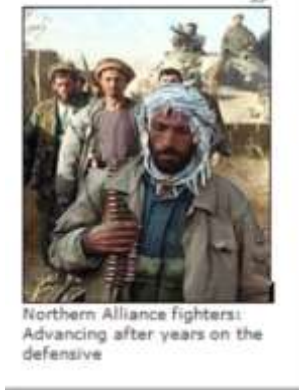
Northern Alliance fighters: Advancing after years on the defensive

این خبر نگار "بی بی سی"، گزارش "آنلاین" خود را از سرحد افغانستان با پاکستان فرستاده است. در همین گزارش هم چنان یاد آور می شود که طالبان، در مدت چهار سال، یعنی از سال ۱۹۹۴م تا ۱۹۹۸م قسمت زیادی از خاک افغانستان را در شمال، بشمول پایتخت، تحت کنترل خود درآوردند. لیکن فقط چند روز را در بر گرفت، که بلاخره "ملیشۀ اسلامی" مجبور به ترک آنچه گردید که در نتیجه جنگ های سخت بدست آورده بود. در پایان عکس زن با چادری، می نویسد که: "طالبان قواعد شدیدی را بر زنان تطبیق نمودند."