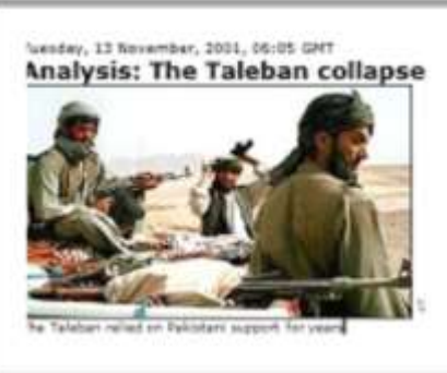
The Taleban relied on Epikotary support for years

در حالیکه گزارشگر "بی بی سی"، با نشر این تصویر جوره، و هم چنان بر اساس برداشت، "رحیم الله یوسفزی" که از "نزدیک ترین" روابط با رهبری "طالبان" و "القاعده" برخوردار بوده است، در پایان همین تصویر خبر می دهد، که: "طالبان نمی توانند توقع داشته باشند که در برابر قدرت آتش ایالات متحده رقابت نمایند." "رحیم الله یوسفزی از پشاور نیز در ضمن گزارش داده، از "ملا عمر، رهبر طالبان" این نقل قول را می فرستد: "... تمام مسلمانان جهان که از اسلام و عقیده آنها حمایت می کنند، باید از افغانستان حمایت کنند." در عین حال، همین شخص در رابطه با وضعیت "تسلیماتی" طالبان، تذکر داده، آنها را در حالت "نا امید" (نومیدی) یافته است، که به نسبت "تجهیز بد بودن"، توان دفاع خود آنها را در برابر "امریکایی ها"، نمی بینند.