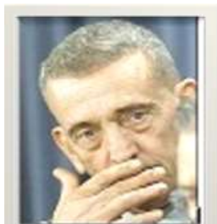
General Franks has given conflicting reports of US aims

مروری بر اخبار رسانه ها، مطلب ذیل توجه نویسنده را بخود جلب نمود. به تاریخ ۹ "نومبر" ۲۰۰۱م، که درست ۳۳ روز از آغاز عملیات بمب باران های هوایی (۷ اکتوبر ۲۰۰۱م) می گذشت، "بی بی سی" در تحت عنوان: "تحلیل: پیغام کنترل در جنگ افغانستان" را با تصاویر منتشر ساخته است. (این تصویر نمایانگر مظاهره است، که در گزارش واضح ذکر نشده است، که بر ضد کی و بر ضد چیست. در پایان تصویر می نویسد: "میدیا ها به تبلیغ و کمپاین به خاطر تسخیر قلب ها و اذهان و تغییر نظرات عامه، دست به کار شده اند.")