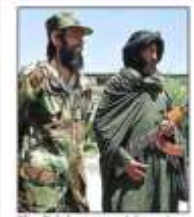
The Taliban cannot hope to match US firepower

سفیر "طالبان" در پاکستان در آنوقت، همین شخص که "ضعیف" می نامیدند، بر اساس گزارش "بی بی سی"، تاریخ ۱۵ سپتمبر ۲۰۰۱م، فقط چهار روز پس از حوادث "نیویارک" و واشنگتن، از خطر "جنگ تلافی جویانه" یاد آور شده است. این شخص که حد اکثر کنفرانس های مطبوعاتی را دایر می نموده است، تقریباً یگانه "دیپلمات" فعال "طالبان" بوده است، قبل از آغاز "عملیات" علاوه از تبلیغات وسیع، در آخرین روز ها، از طریق ترجمان گفته است: "... هرگاه قوای امریکائی داخل خاک افغانستان شوند، آنوقت جنگ حقیقی آغاز می یابد."