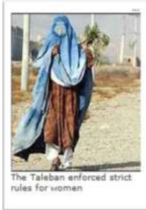
The Taliban enforced strict rules for women

گفته می شود که درین فرصت، جناب حامد کرزی بحیث، "رهبر قومی یک گروپ جنگی ضد طالب" در مربوطات قندهار بسر می برده است. در ادامه عملیات خبر نگار "بی بی سی"، "دانیل لاک" (Daniel Lak) درست به تاریخ ۱۳ "نومبر" ۲۰۰۱م، در یک "تحلیل" خود، از "فرو پاشی" طالبان خبر می دهد. قابل تذکر است، که گزارشگران "غربی" در همه گزارشاتی که در باره "سیاست طالبان" منتشر می ساخته اند، در جمله افشای "مشی افراطی"، "عقبگرا" و "مغایرت اعمال و کردار آنها بخصوص، علیه زنان که با اصول حقوق بشر، در ضدیت بوده است، با سایر حالات غم انگیز زنان برجسته می ساخته اند. در جمله موضوعات مختلف چون منع از "کار" در خارج خانه، مسدود ساختن مکاتب دختران و اخراج کارمندان دولتی و اجتماعی زن از کار و منع بیرون شدن زنان، از خانه بدون بدرقه مردان "محرم" و غیره تذکر می داده اند.