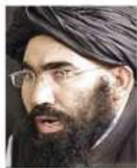
Case: Threat of war of spiritual

همین ژورنالیست، سفیر طالبان را بعنوان منبع مهم می داند که قصه های زیادی از تلفات ملکی پخش می کند. برای ژورنالیستان دشوار بوده است، تا حقیقت را دریابند. زیرا نمی توانسته اند ویژه دخولی به کشور دریافت نمایند. حال مقامات پاکستانی، بر اساس اظهار همین "ژورنالیست"، به این نماینده گفته اند که "بی سی" خود را پائینتر بنوازد و به قواعد و اظهارات "دیپلماتیک"، پابندی داشته باشد، که بطور مؤثر او را از "جنگ اطلاعاتی" دور می سازد. البته "بی بی سی" در ماه اکتوبر تصاویر زیادی از مخروبه های حملات هوایی نیز نشر نموده است. این تصویر از یکی گزارشات تاریخ ۱۲ اکتوبر ۲۰۰۱م گرفته شده است، که در عین زمان از منابع "اف بی آی"، اخبار تهدید جدید از جانب سازمان تروریستی نیز نشر نموده است. (در پایان عکس فوق، تذکر می دهد که: "طالبان می گویند که تعداد زیاد ملکی ها، کشته شده اند." )