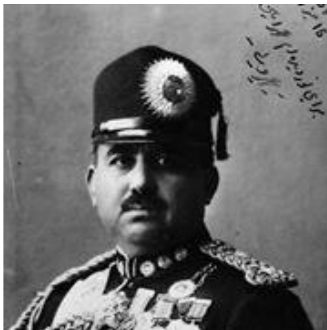
محمد ولی خان دروازی

محمد ولی خان دروازی از جمله معدود دوستان و حامیان غازی امان الله خان بود که تا آخر عمر به وی و نهضت امانی وفادار ماند و نه تنها درین راه جان شیرنش را از دست داد، بلکه خانواده و بازماندگانش نیز مانند خانواده های غلام نبی خان چرخ، غازی میرزمان خان کنری و ده ها آزادی خواه و مشروطه خواه دیگر تا مدت ها مورد خشم دست نشاندگان استعمار انگلیس قرار گرفته و حتی اطفال شان از نعمت مکتب و تعلیم محروم گشتند.