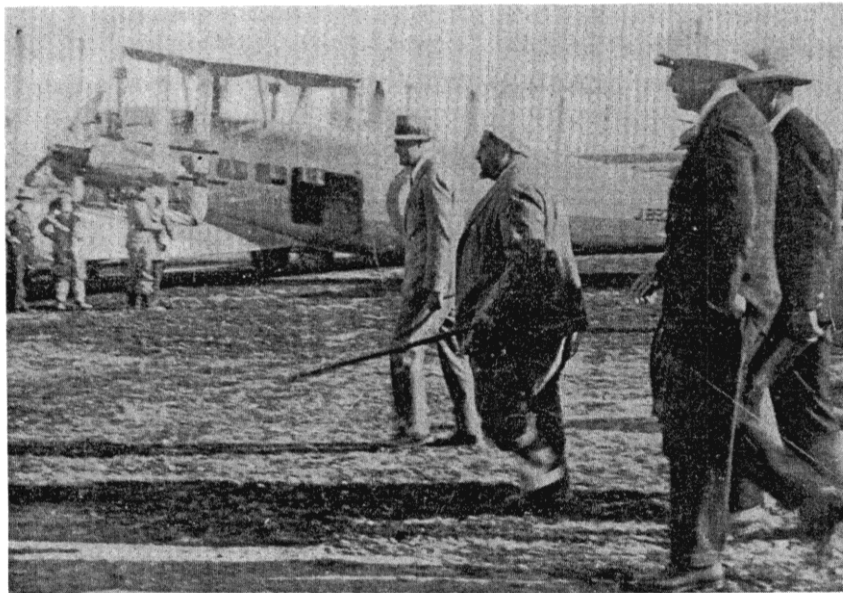
سردار عنایت الله خان بعد از رسیدن به پشاور