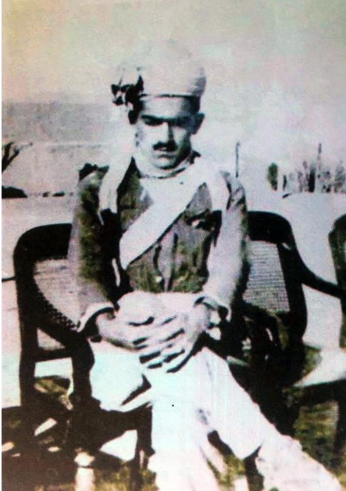
سید اکبر خان ببرکزی

- د نیویارک تایمز ورځپاڼې د رپوټ په اساس خانداني حکومت له یوې خوا د لیاقت علیخان د وژل کیدو د پېښې وروسته سمدلاسه ادعا وکړه چې سید اکبر خان د خپل ملت سره د دښمنانه فعالیتونو له امله د افغان تابعیت څخه بې برخې شوې دی، له دې امله بریتانوي چارواکو هغه ته په صوبه سرحد کې پناه ورکړې وه، او د بریتانوي هند او بیا وروسته پاکستان له لورې هغه ته یوه اندازه معاش هم ټاکل شوې و.