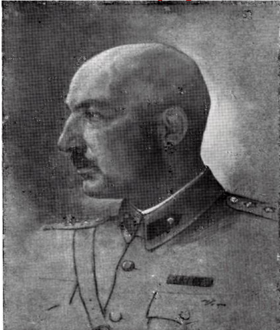
سردار محمد داؤد خان د قواي مرکز قوماندان

د ۱۹۴۴ کال د دوبي په جريان اعلیحضرت محمد ظاهر شاه، صدراعظم سردار هاشم خان او د دفاع وزير سپه سالار شاه محمود خان