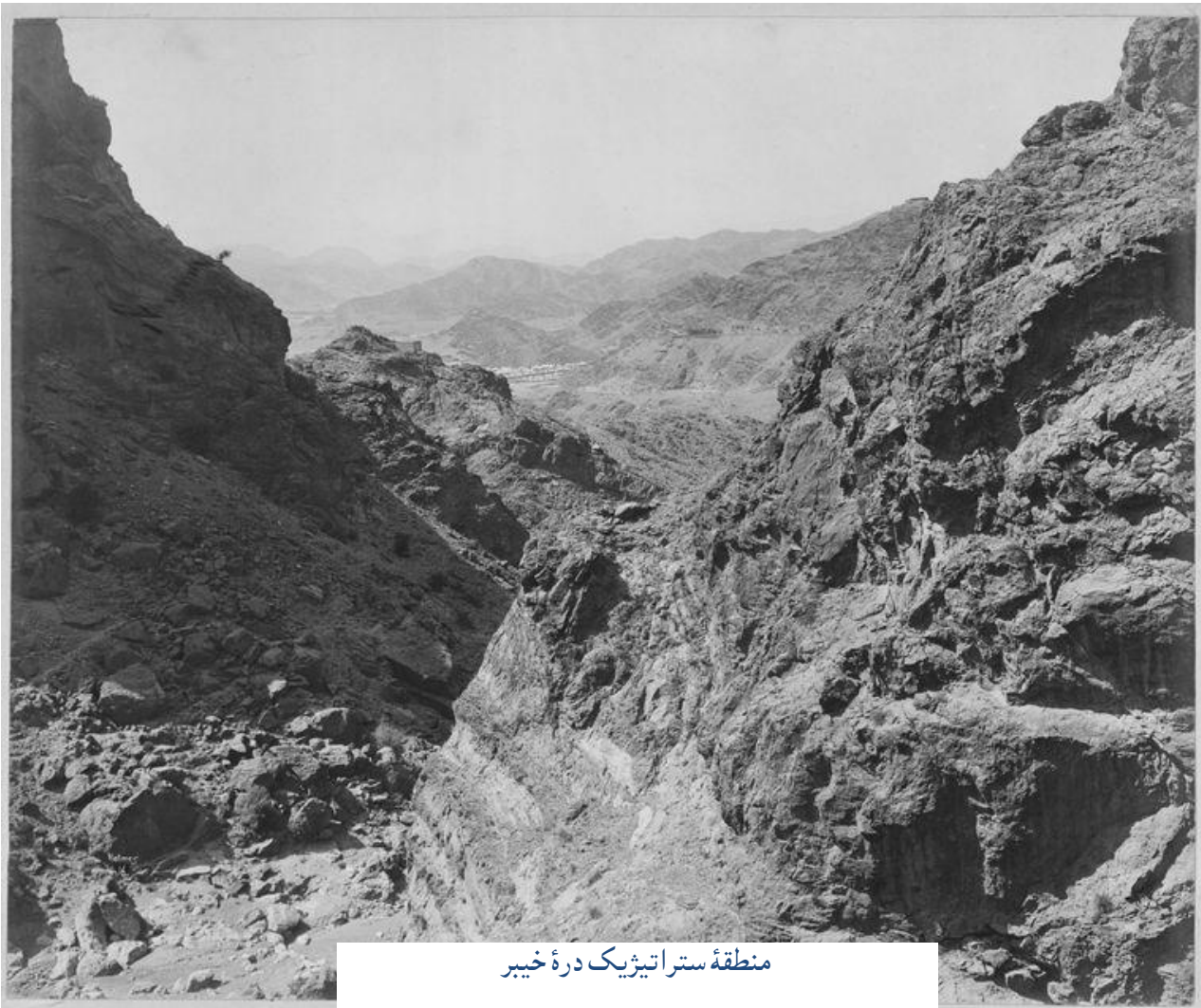
منطقه ستراتیژیک دره خیبر

بتاریخ ۴ می ۱۹۱۹ نایب السلطنه هند بریتانوی ترجمه فرمان غازی امان الله خان را به وزیر امور هند در لندن فرستاده و مینویسد که "باوجودی که فرمان امان الله خان سخت ناهنجار است، او باز هم بصورت قطعی دستش را از آستین نکشیده است [اعلان جنگ نکرده است]. ما به روز کیپل (کمشنر عالی ایالت سرحدی شمال غربی) در رابطه با اهمیت