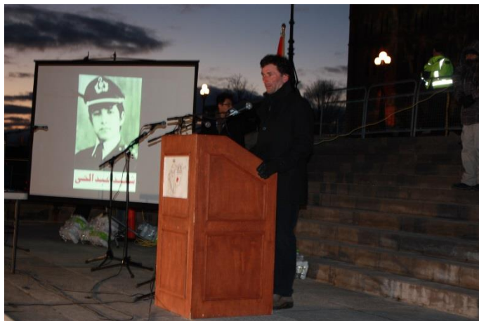
آقای پال دیوور عضو پارلمان کانادا حین سخنرانی در گردهمایی یادبود شهدای سالهای ۵۸-۱۳۵۷

پس از سخنرانی آقای پال چمپ، آقای پال دیوور عضو پارلمان و منتقد امور خارجی حزب عمده مخالف دولت (حزب نیو دموکرات) که حیثیت وزیر خارجه منتظر را دارد با وجود آنکه قبلاً از تصمیم خود مبنی بر سخنرانی به سازماندهندگان یادبود اطلاع نداده بود اجازه سخنرانی خواست. وی اظهار داشت که فقط یک ماه قبل از حادثی که اکنون افغان - کانادایی ها بخاطر یادبود آن گردهم آمده اند اطلاع حاصل کرد. وی وعده سپرد که با سایر اعضای پارلمان در مورد مطالبی که در ۳۵ سال گذشته در افغانستان صورت گرفته صحبت خواهد کرد. وی گفت که وقتی جنایتی علیه بشریت صورت می گیرد باید برای برقراری عدالت کار کرد چون بدون عدالت صلح میسر نمی شود، ولی اگر کسی برای برقراری عدالت کار نکند عدالت تأمین شده نمی تواند تا صلح تأمین شود. آقای پال دیوور گفت که تعهد می کنم هر آنچه در توانم است برای اجرای عدالت به قربانیان فجایع افغانستان در پارلمان انجام دهم.