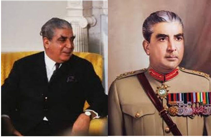
(د پاکستان ولسمشر جنرال یحیی خان)