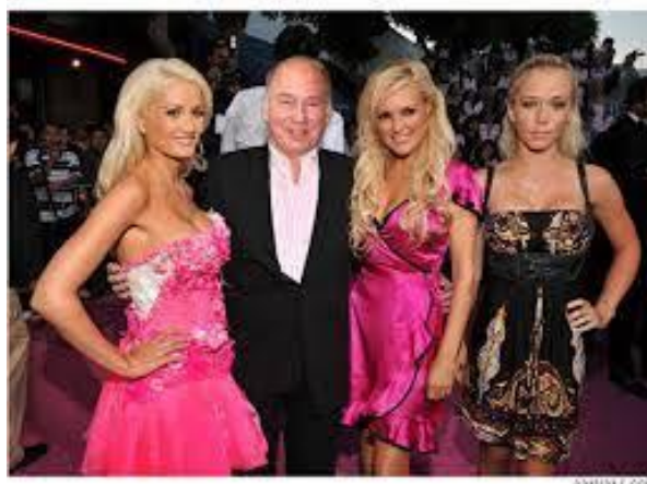
كريم آقا خان (آغا خان) رهبر مذهبي اسماعليه Kabul Press