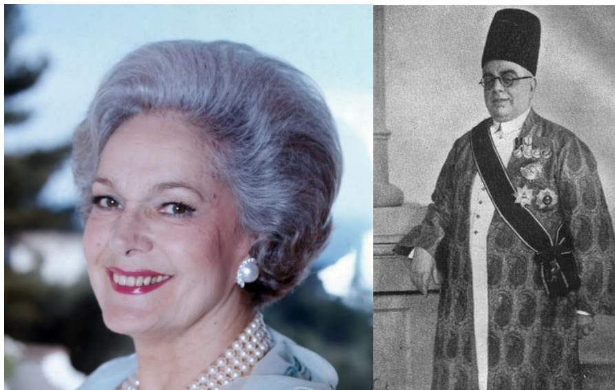
(درېيم آغاخان، سلطان محمد شاه حسيني او د هغه ميرمن)

عياشيو كې بوخت دى او د نړۍ له سترو پانگوالو څخه دى چې اوسمهال د هغه شتمني ۱۳،۳ ميليار دو ډالرو ته رسيري او ډېرى خيريېه چاري هم ترسره كوي.