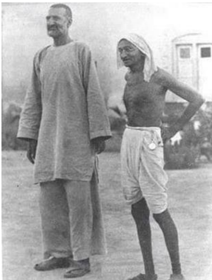
ګاندي جي او فخر افغان خان عبدالغفار خان

- پښتونخوا: چې د پښتنو سيمه ده او د لوی افغانستان نه بېلېدونکي خاوره ده. لکه وړاندې چې يادونه وشوه، د بلوچستان او پښتونخوا سيمې د انگرېزانو او امير عبدالرحمن خان (چې د انگرېزانو له خوا ټاکل شوی ؤ) د ۱۸۹۳ز، کال د يو ناولي تړون له امله له افغانستان څخه په جبري توگه جلا شوي دي. ولي خان په خواشينۍ سره د خپل پښتون ولس د توتې کيدو په اړه وايي: «پېرنگي څرنگ دا د پښتون قام توتې، توتې کړ: څه په افغانستان، څه په ياغيستان (آزاد قبائل) څه قبایلي علاقه، څه ايجنسي، او څه يې رياستونه (سوات، چترال، ډير، امب، خار او ...) او څه يې د خپلې خپتې لاندې د صوبه سرحد په نامه لاندې کړ.» (رښتيا، رښتيا دي. ۱۴۱مخ)