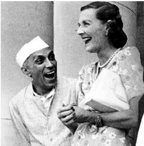
(د هند وروستني وایسرای، لارډ ماونټ بیټن میرمن او جواهر لال نهرو)

راتلونکي په هکله پرېکړه وکړي، هغوی ته باید په دې لار کې خنډونه رامنځ ته نه شي، په راروانه ټولپوښتنه کې باید دوی ته حق ورکړل شي چې له افغانستان سره یو ځای شي یا هم ځان ته بېل خپلواک دولت جوړ کړي.»