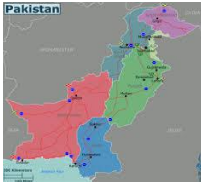
(د پاکستان سياسي نقشه)