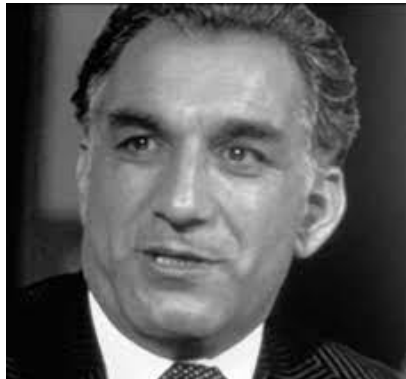
(د افغانستان سل ورځنی ديکتاتور)