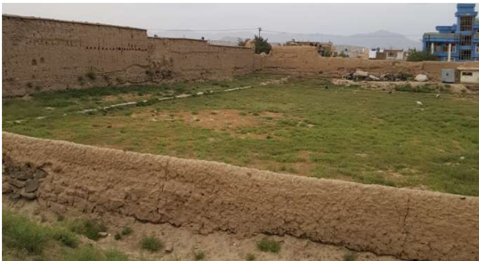
د زړی کلا انځور

که مونږ انځور ته په ځير سره وگورو، په هغه کې د کوتو د چت دستک لرگيو سوري (چاپونه) او هم په دېوالونو کې د طاقي ځايونه په سمه توگه ليدلی شو.