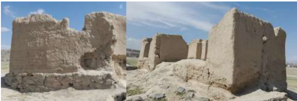
د بڼوالو د اوسيدو کوټو يوې برخې انځور