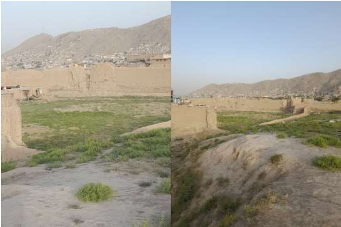
د زری کلا انځورونه