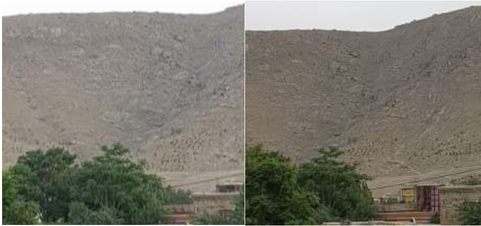
د (قول چشمه) چيني خور، انځورونه

د کلا شاو خوا يې سل گونه جريبه ځمکه درلوده چې په لږ وخت کې د چيني د او په ذريعه اوبه کېدې، دا چينه د شير دروازه غره (کوه شير دروازه) په يو خور کې چې (قول چشمه) نومېده، موقعيت در لوده.