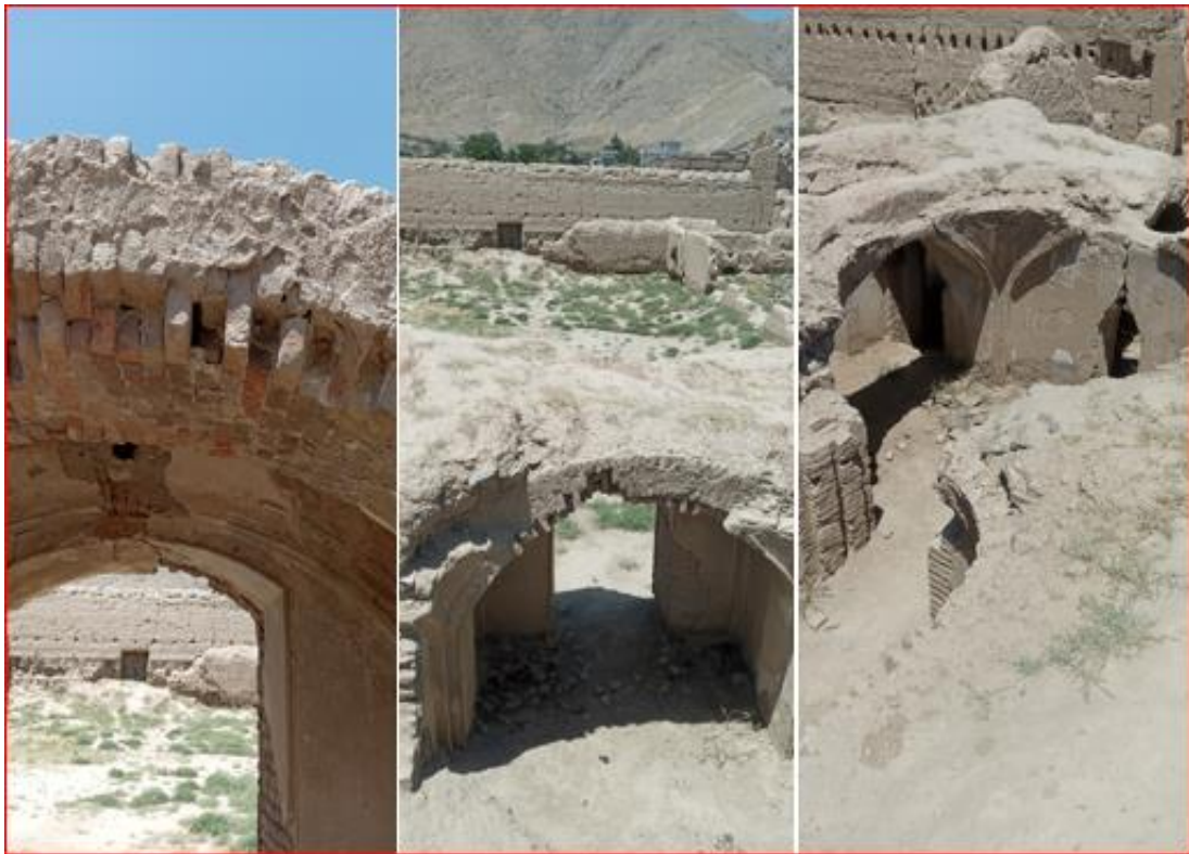
کوتو د بامونو گنبدونه

د کوتو چټو نه يې گنبدې دي، کوم چې معماري يې د بلخ ولايت نه لېږدول شوي ده. د چټ خښتې يې پخې او د چوني د مصالې(مصالح) په مرسته يو د بل سره کلکې شوي دي، دا خښتې په نيغه (تېغه) کارول شوي دي.