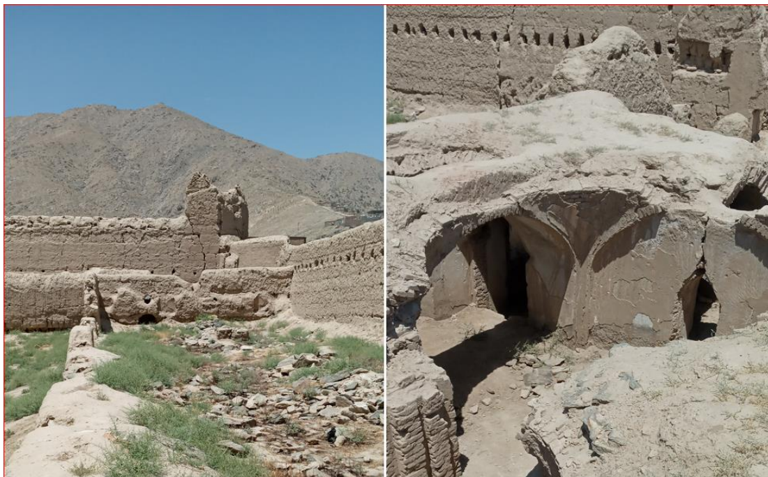
د حشمت خان د کلا شاوخوا، د کونړو شتون نښي په دېوالونو کې

له هغو نه د کابل ښار عاشقانو او عارفانو شاوخوا کورونه، شور بازار، د پېښورپانو سرای، مرادخاني او بي بهي مهرو کورونو، نومونه اخيستی شو.