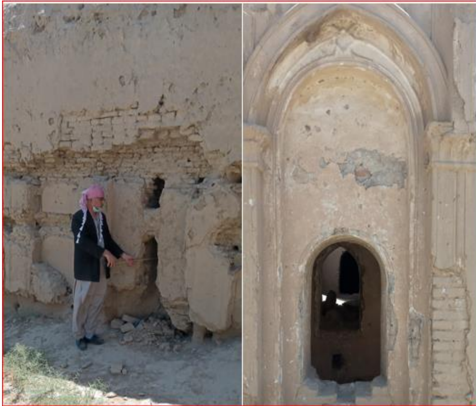
د کلا د ننه اړین، انځورونه

تېمورشاه څه موده د حشمت خان په کلا کې اوسېدل غوره کړ، کوم چې بالاحصار ته ډېره نږدې سیمه وه، همدا راز اعلیحضرت محمد ظاهر شاه به هم دې کلا ته د ماښام او یا د ورځې له خوا ته او سهار وختي به د لویې دروازي مخاڅ ډنډ ته، ته او هلته به یې ښکار کوه، ځکه چې محمد ظاهر شاه د حشمت خان سره کورنۍ اړیکې درلودې.