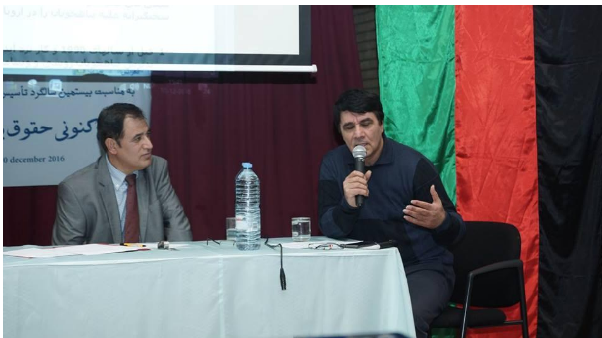
یادونه: دلپکنی د لیکنیزی بنی پازوالی د لیکوال په غاره ده، هیله من یو خپله لیکنه له رالیرولو مخکې په خیر و لولئ