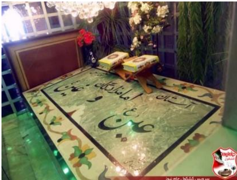
آرامگاه امام زادگان «عین» و «غین» علیهما السلام در ایران