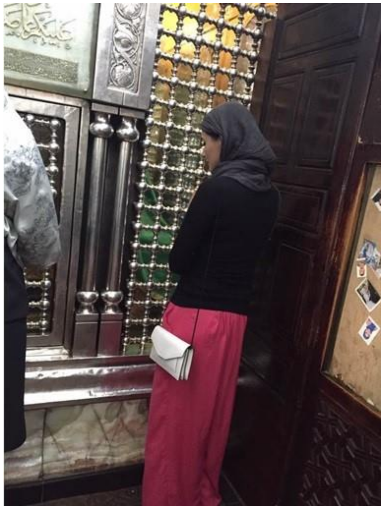
آرامگاه منسوب به زینب کبری بنت علی رضی الله عنهما - قاهره