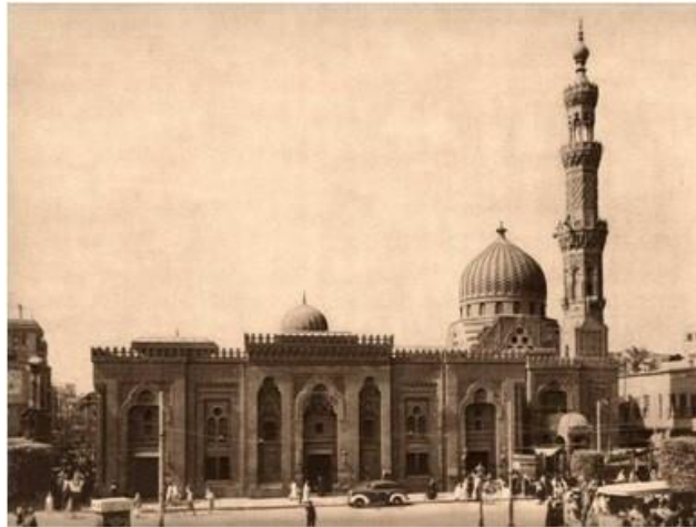
مسجد سيده زينب در قاهره - مصر