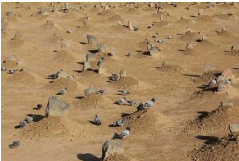
قبرستان بقیع در مدینه منوره - در حال حاضر