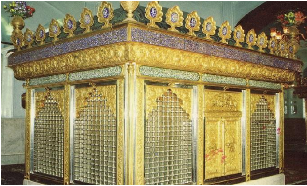
آرامگاه منسوب به سیده زینب در قاهره- مصر