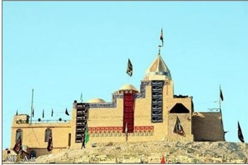
آرامگاه منسوب به سیده زینب در شنگال (سنجار) موصل - عراق