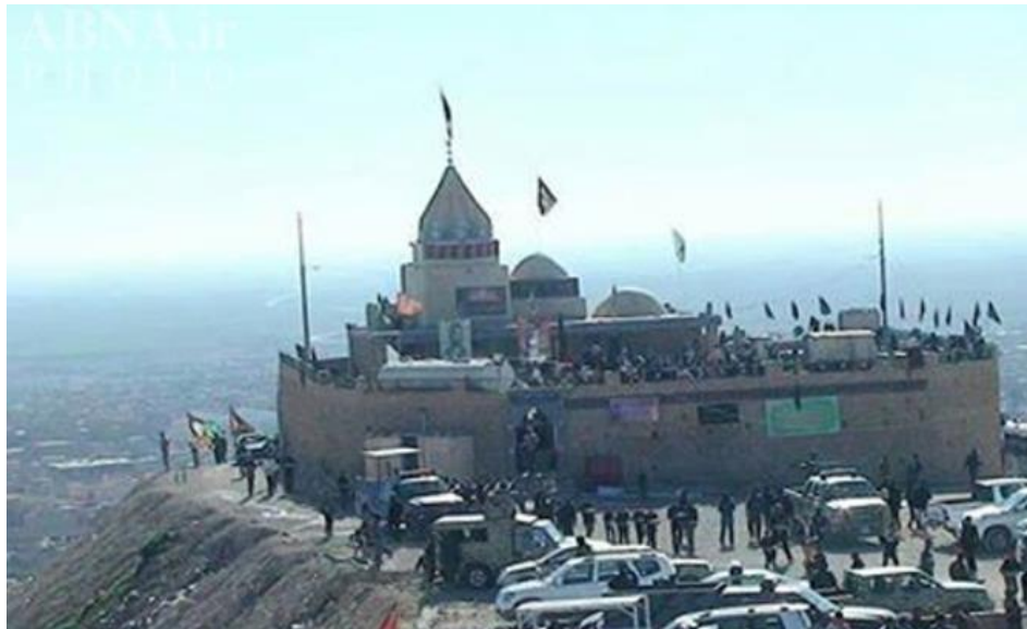
آرامگاه منسوب به سیده زینب در شنگال (سنجار) موصل - عراق