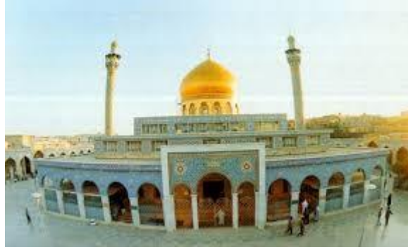
مسجد سیده زینب در دمشق