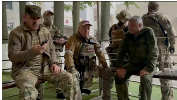
در مقر فرماندهی نظامی روستوف روی دون .

آنچه تا جمعه شب نامشخص بود، اکنون از روز شنبه کاملاً مشخص شده است: همه جهنم ها در این اولین لحظه مهم در بیش از دو دهه تسلط آهنین پوتین بر قدرت توسط شورش مسلحانه در حال شکستن است . پوتین در این سخنرانی تلویزیونی گفت: "هر گونه آشفتگی داخلی تهدیدی مرگبار برای کشور ما و ما به عنوان یک ملت است . این ضربه ای به روسیه و مردم ما است ." این نبرد، زمانی که سرنوشت مردم ما مشخص می شود، نیازمند اتحاد همه نیروهاست .