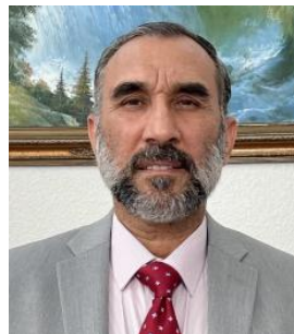
د لیکوال نورې لیکنې په دې لینک کې ولولئ