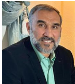
د لیکوال نوري لیکنی په دی لینک کې ولولی

د مرکې په پای کې مې ورته د ( تصوف؛ روحانیت او کبرلېچونه) اړوند خپل وروستی کتاب ډالی او په ډیرې خوښې سره یې قبول کړ؛ دا یې هم وویل چې ستا نور چاپ شوي کتابونه هم راکړه.