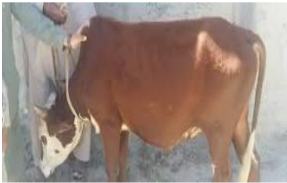
عکس گاو کنری

گاو زابلی یا گاو سیستانی از نوع گاو های کوهان دار برنگ سیاه بوده در بسا موارد رنگهای سیاه سفید و یا ابلق نیز میداشته باشند. مالداران مناطق سیستان و بلوچان بیشتر آنها نگهدارند. این نوع گاو ها جثه بسیار بزرگ داشت و گوساله های آن تا چهارصد کیلو وزن داشته و بسیار با سرعت فربه میگردند و همچنان با شرایط محیطی گرم و خشک صحرایی سازگاری داشته و تحمل کم آبی را دارند.