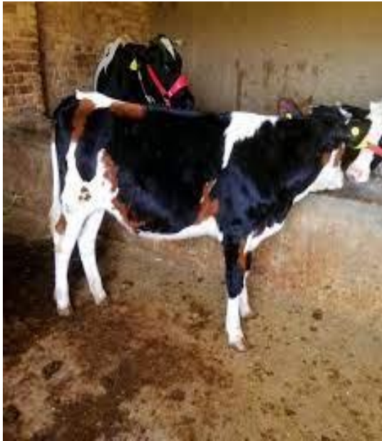
عکس گاو کابلی

گاو کابلی جنه کوچتر داشته وزن آن بین ۳۰۰ تا ششصد کیلو گرام بوده و در اکثر ولایات افغانستان بوفرت نگهداری میشود.