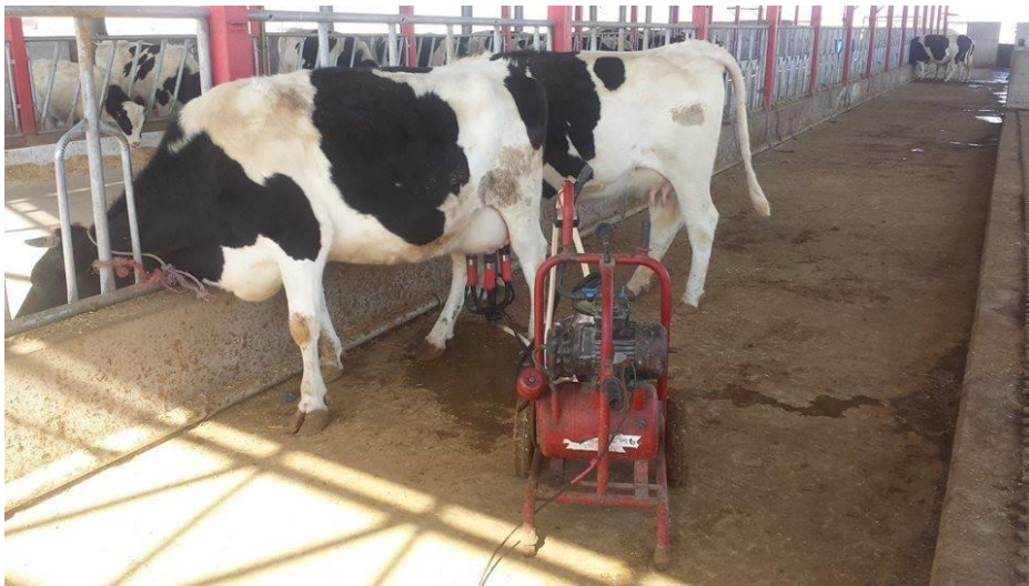
عکس گاو قندهاری

غزگاو که نام علمی آن بوس گرونینس Bos grunniens بوده، این نوع گاو ها موهای دراز داشته و دم موی دار اسب مانند دارند و انواع مختلف آن رامالداران ترکمن و تاجیک ساحات شمال و شمال شرق و بلندی های پامیر افغانستان نگهدارند و بیشتر برای بارکشی و شیر و تولید گوشت پرورش میابند. وزن این غزگاو ها بین ۳۰۰ تا ۱۰۰۰ کیلو گرام میباشد و انواع بزرگ آنان ارتفاع تا دو متر میداشته باشند.