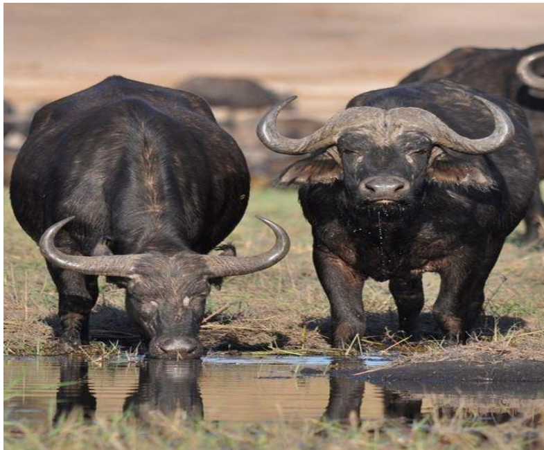
عکس گاو میش

گاو میش با جثه بسیار بزرگ که بین ۴۰۰ تا ۷۰۰ کیلو گرام وزن دارد و بیشتر در ولایات ننگرهار، کنر، پکتیکا، خوست، قندهار و هلمند نگهداری میشوند.