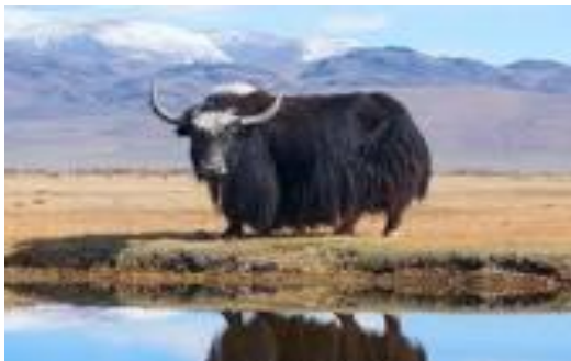
عکس غزگاو پامیری

غزگاو که نام علمی آن بوس گرونینس Bos grunniens بوده، این نوع گاو ها موهای دراز داشته و دم موی دار اسب مانند دارند و انواع مختلف آن رامالداران ترکمن و تاجیک ساحات شمال و شمال شرق و بلندی های پامیر افغانستان نگهدارند و بیشتر برای بارکشی و شیر و تولید گوشت پرورش میابند. وزن این غزگاو ها بین ۳۰۰ تا ۱۰۰۰ کیلو گرام میباشد و انواع بزرگ آنان ارتفاع تا دو متر میداشته باشند.