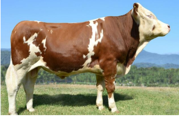
عكس گاو شیری هولشتاین