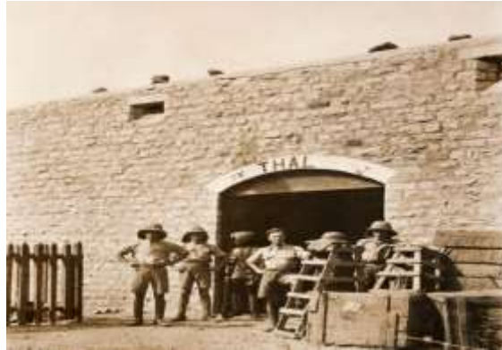
قلعه تل که توسط جنرال نادرخان فتح شده بود؟

(سند 559. اف 33) بخش خارجه ۲۹ نوامبر ۱۹۳۳ آرشیف ملی هند )