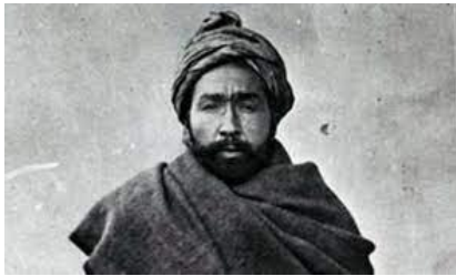
دسقاو زوی حبیب الله

دی، یاهم د کوم بل ولایت اویاهم علی برادران وي دوی دغه تورترې چې دوی دکابل امیرپر هندوستان باندې واکمن کیدو ته رابولي، چې دکابل هغه امیر به شاه امان الله خان صاحب اویا کوم بل څوک وي، کله چې د ۱۹۲۷ کال په دسامبر کې ما دمدراس د کانگریس او دکلکتې د مسلم لیگ په غونډو کې چې هغه دهندو او مسلم د یووالي په موخه جوړې شوي وي په ډیره عاجزانه توګه د مولوی جی د یووالي د وینا ستاینه اوملاتروکردهغو په پای کې چا گاندي جی ته دا تر غور ورتیره کړه چې گواکي ما نعوذ بالله ذالک مالوی جی ته سجده کړي ده، ددغه ثمرنوبهار تر خوریدو څو ورځې دمخه شاه امان الله خان اویاهم د تخت وارث دلته بمبې ته را ورسید، زموږ خلافت والود الله اکبر د نارو په پورته کیدو سره هغوی خپله داومنه دهندو او مسلمانانو ترمنځ هسی هم ډیروینی تویی شوي په دغه اړه تر ټولو ښه خبره داشوه د شوکت صاحب د ډلو په ګډون یوه ګډه غونډه را ولله نوآیا دداسې غونډې په جوړولو کې د افغانستان اویاهم په بمبې کې دنورو اوسیدونکو لاس و، په بمبې کې د دیوان چمن لال دهندو ډلې ددې دردي ښې زما ترسترګولاندې تیرې شوي چې زیاتې ته یې په دغه اړه اړتیا نشته، حضرت شاه اسمعیل شهید په هندوستان کې د انگریزانو خلاف جهاد کول غوښتل، خود مصلحت له مخې یې په سرحد کې د سیکانو د غلامی خلاف جنډه پورته کړه، کاشکي چې زموږ مکرم چمن لال صاحب دافغانستان کې د سقاو له زوی څخه دآزادۍ پرځای په پنجاب کې د انگریزانو د آزادۍ په خاطر د پوځ ټولول او برتې کول پیل کړي وای لکه چې د شیخ سعدي خبره ده :