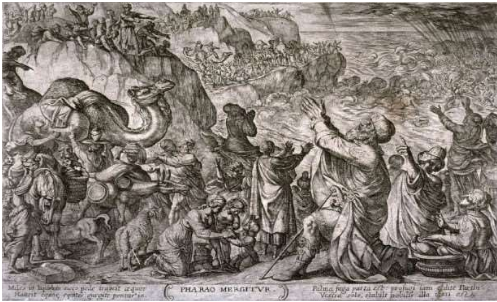
انخور له کورگله