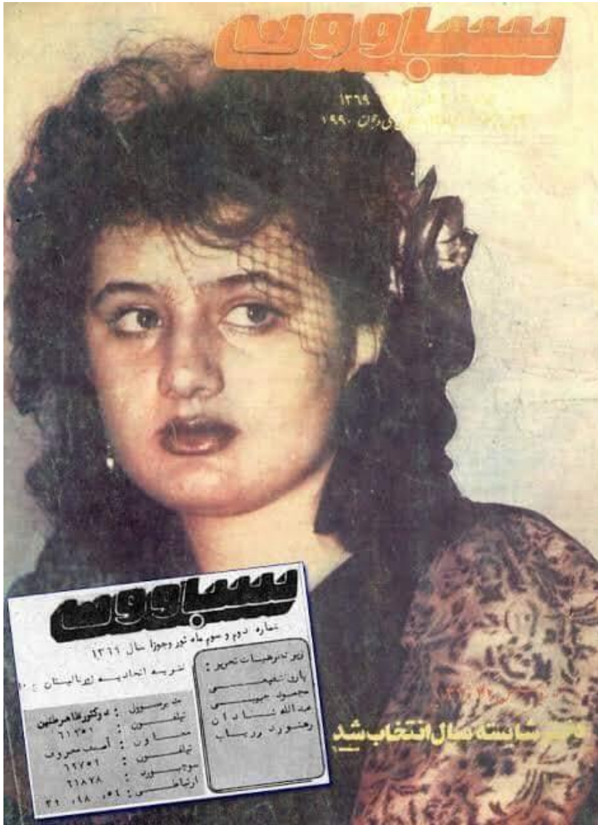
دسباوون مجلې يوه گڼه

ملي ژمني په وړاندې دوه رنگي تگلاره ولري، نجيب الله هغه څه چې دغه ملت په شلمه پيړۍ کې اړتيا ورته درلوده چې هغه سوله وه له خلکو پټه نه کړه او هغه يې ديوې ملي اړتيا په توگه اړينه وبلله، هغه دخپل مکار تاريخي دښمن پاکستان په وړاندې چې دافغانستان دبربادۍ ذمه يې امریکا ته وهلي وه سخت بې رحمه و، هغه دلومړي ځل له پاره د اختناق د دورې د پای ته رسيدو پر لامل د مطبوعاتو د آزادۍ له پاره لومړنی گامونه اوچت کړل، ملي ورځپاڼې، ديوشمير ملي اومتري څيړو لکه شازمان وريځ، سخي غيرت، او همداسې يوشمير دولتي آزادي څيړونې لکه سباوون، اخبار هفته او قلم څيړونې او جريدې وې چې آزادۍ څيړونې يې کولې او خلکو ته يې پر دولت او حکومت باندې دانتقادي جرأت ورکاوه. په هيواد کې دخبره کسانو، ليکوالو او شاعرانو خبرو خپلو ځای درلود، په ادبي او فرهنگي برخو کې روڼ اندو ته د ځانگړو او خپلواکو ټولنو او انجمنونو د فعاليتونو لارې اوارې شوې دخوشحال، سيد جمال الدين، مولانا، هرات، سنایي، ناصر خسرو ټولني او انجمنونه دداکتر نجيب الله په دوره کې را پورته او په فعاليتونو يې دافغانستان په مرکز کابل اونورو ښارونو کې لاس پورې کړ.