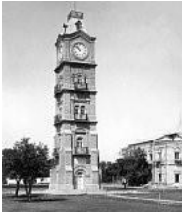
برج ساعت پل محمود خان چی جمیز میلر جوړ کړی و. ۱۹۰۷

زما لپاره او کيدای شي دهرلوستونکي لپاره د دومره زياتوپوځيانو بيول اودهغوی پرتم بنودل، د اميرله هغه فطری اوشعوري درک سره په ارتباط کې خبره ده چې له يوه خپلواک او پرماضي مين واکمن سره دفرصتونو په پام کې نيولو سره مطرح وي . ځکه دتاريخ په اوږدو کې هرواکمن تل خپل واکونه اومجبوريتونه درلودل ، چې په اوسني عصري کې هم دغه لړۍ په څرگنده توگه زموږ ملت، زموږ لاجاري واکمنان تر هغه مهال په بدرنگو ډولونو کې پر ځان اوملت باندي ويني اودهغوی په کچه يې هم پر وړاندې څه نه ويلاي شي اونه کولای !!! .