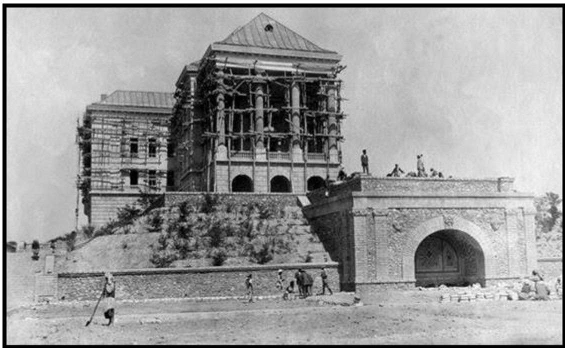
تصویر ۵ (بازسازی قصر چهلستون در زمان ظاهر شاه.)

این باغ دارای چهار دروازه بود. دو دروازه عمومی که بطرف شمال و غرب باغ موقعیت داشتند و دو دروازه فرعی که به طرف شرق و غرب قرار داشتند. در زمان سلطنت محمد ظاهر شاه، طی سال‌های ۱۳۲۷ تا ۱۳۴۳ این قصر بازسازی و نوسازی شد.