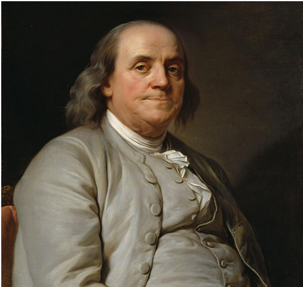
بنجامین فرانکلین (۱۷۰۶ – ۱۷۹۰)