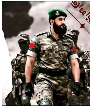
ملا محمد یعقوب وزیر دفاع ملی