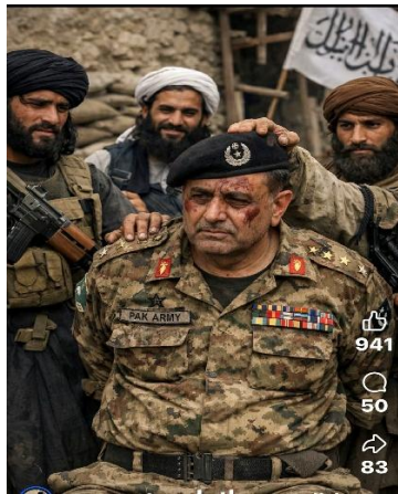
جنرال اسیر پاکستانی