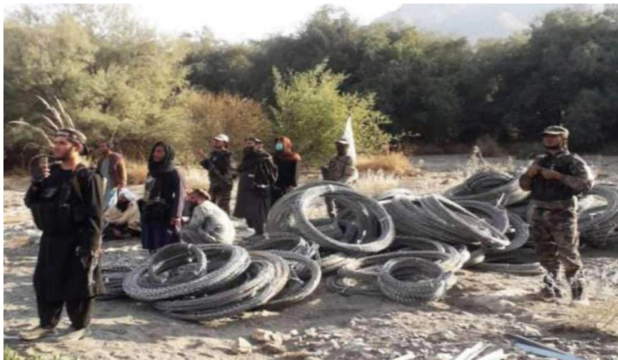
جمع آوری سیم خاردار از خط دیورند