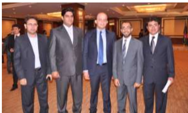
مراسم تجلیل از سالگرد استرداد افغانستان