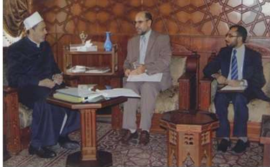
استاد محمد محقق، دکتور نصیر احمد نور و امام اکبر پروفیسور دکتور احمد الطیب