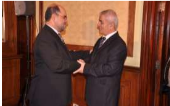
دکتور نصیر احمد نور و سفیر تاجکستان در قاهره. 2011م