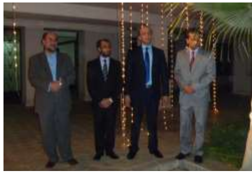
تجلیل از نود و یکمین سالگرد استرداد استقلال کشور در سفارت افغانستان- قاهره