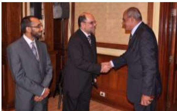
سفیر افغانستان و آقای محق در حال خیر مقدم گفتن به مهمانان. 2011م