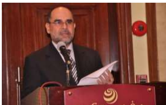
بزرگداشت از نود و دومین سالگرد استرداد استقلال. 2011م – قاهره