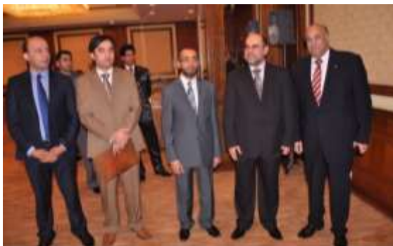
دکتور نصیر احمد نور با دیپلماتان سفارت افغانستان در قاهره. 2011م