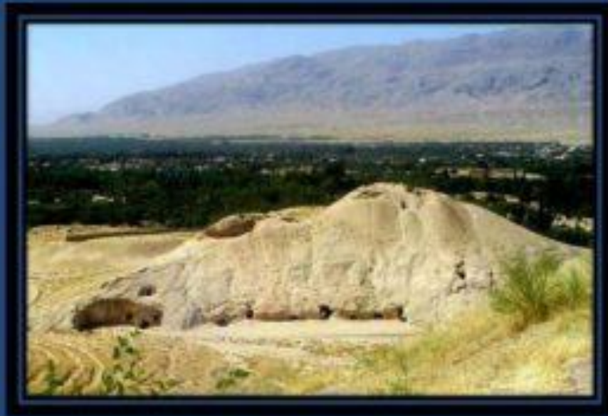
ساختمان بیرونی تپه مقابل

شهریاستانی ایبک که تا اوایل ادواراسلامی بنام ادیسی یاد میشد، در دوره زمامداری کوشانی ها مانند خلم یکی از مراکز عمده تجاری و تبادلته های فرهنگی بود و بدیهیست که بازرگانان، زائرین و مردمان صاحبان فکرواندیشه از هردیار در آنجا می آمدند، تبادل نظر مینودند و از همدگر می آموختند. از سوی دیگر سکه های که مربوط به عصر غزنویان است و از اینجا کشف گردیده تأکید به این نکته دارد که ایبک یا ادیسی باستان در هنگام اعتلای تمدن خراسان نیز یکی از شهرهای مهم بازرگانی در ادوار اسلامی بوده است.