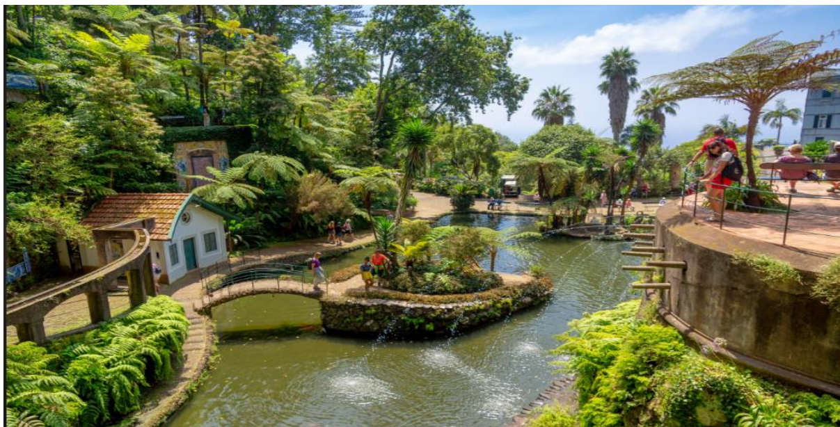
پارک کنار ساحل

پس از بازگشت به کشتی و استراحت آرام، مقصد بعدی ما بندر تاریخی و زیبا به نام فونچال مرکز جزیره مادیرا در پرتغال (Funchal Madeira) PARUGAL بود، طبق برنامه، کشتی ما به تاریخ ۲ جون ۲۰۲۵ به سوی این جزیره حرکت نمود و پس از گذر شبی دل‌انگیز در بحر بیکران اتلانتیک، صبح هنگام در آب‌های اطراف این بندر زیبا نمایان شد. حدود ساعت ۸ صبح کشتی در بندر فونچال پهلو گرفت.