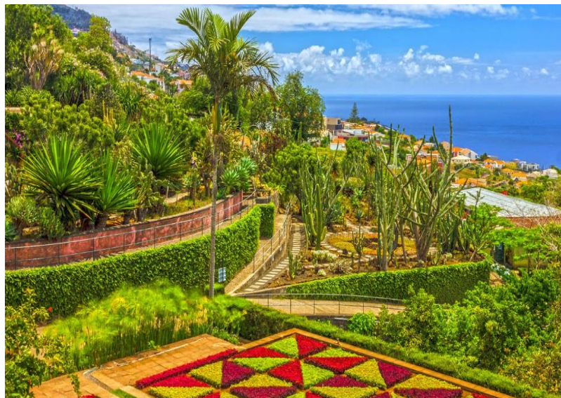
خط السیر کشتی در بحربه فونچال