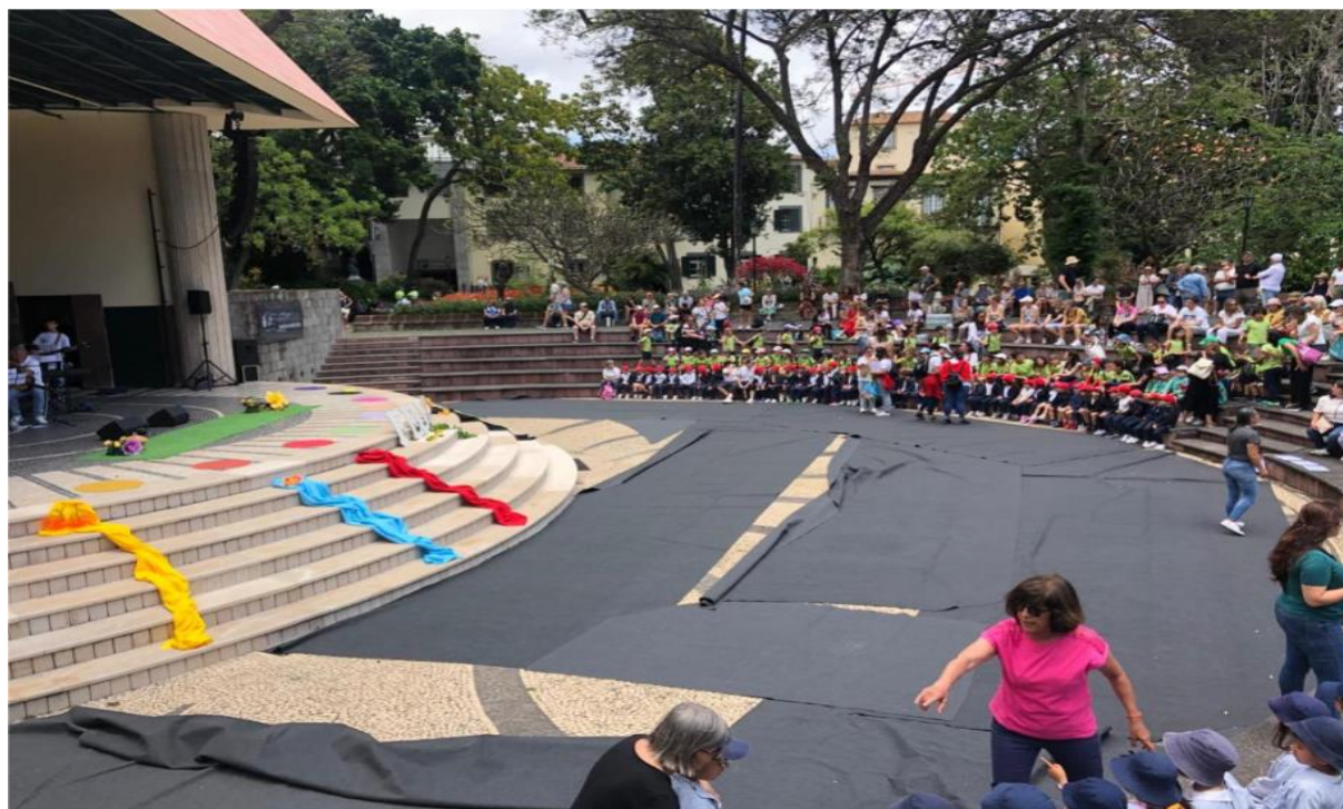
تئاتر سربازشاروالی شهر

(فونچال Funchal) شهری است با پیشینه‌ی تاریخی غنی، طبیعت سرسبز و ساختار شهری مدرن که ترکیبی کم‌نظیر از اصالت و نوگرایی را به نمایش می‌گذارد.