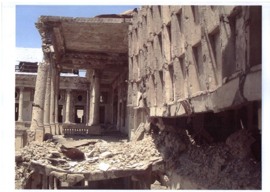
نمایی جنوبی از خرابه های قصر تاریخی دارالامان