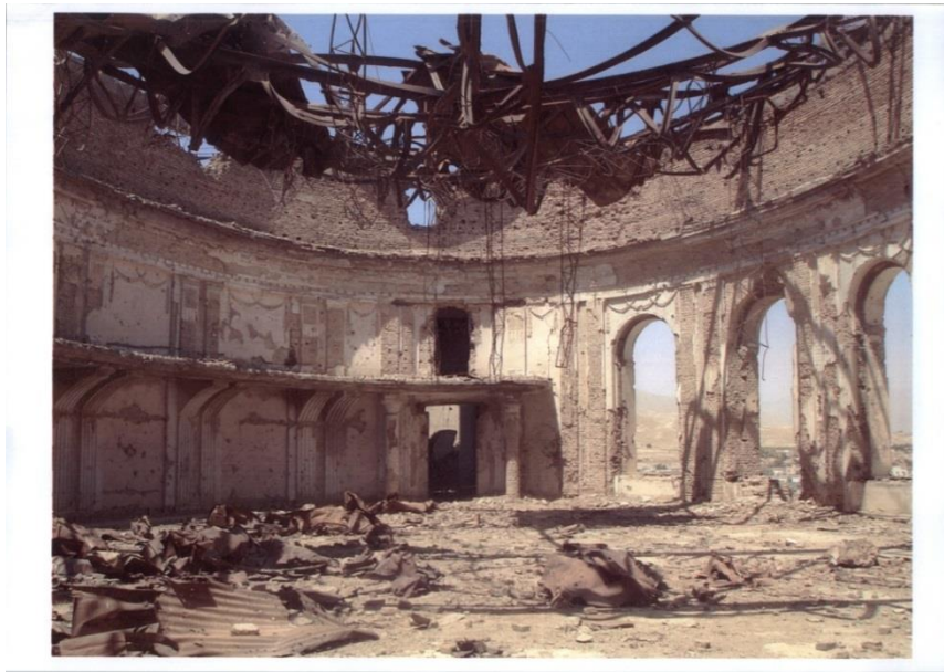
نمای داخلی تالار عمومی مجلس شورا ، از خرابه های قصر تاریخی دارالامان