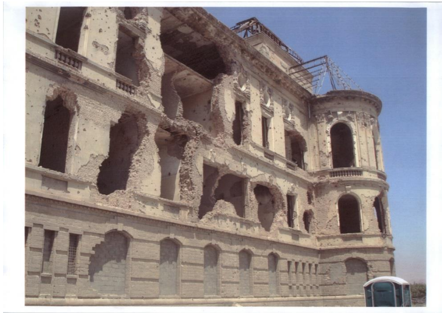
نمای شمالی خرابه های قصر تاریخی دارالامان