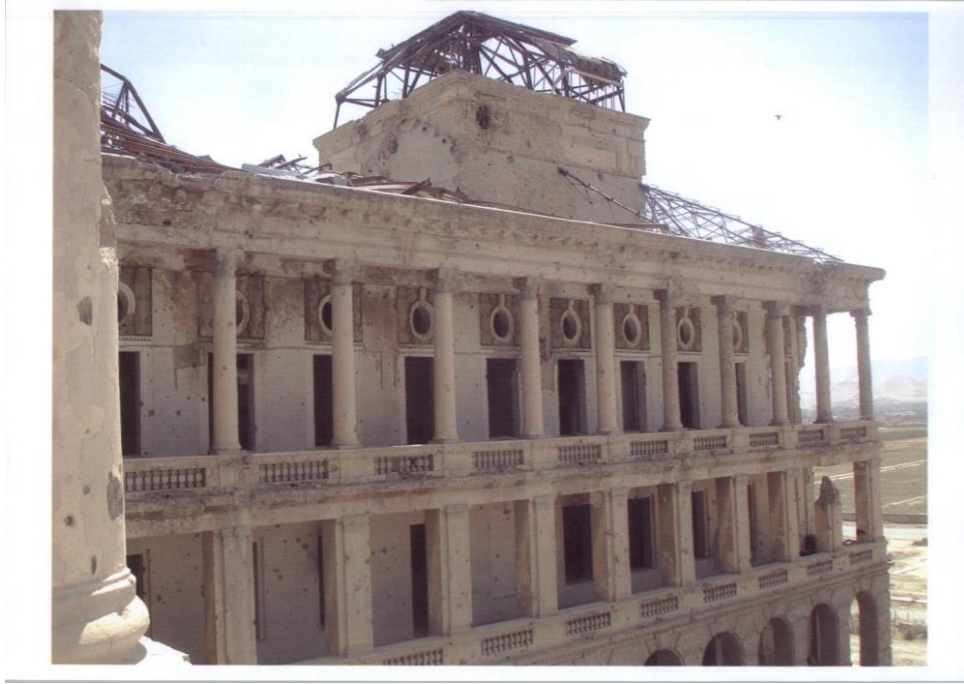
نمایی غربی از خرابه های قصر تاریخی دارالامان