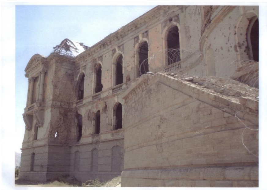
نمای شمالی خرابه های قصر تاریخی دارالامان

در ادامه تصاویری از تخریب های مهیب کاخ تاریخی دارالامان (کاخ) را مشاهده می کنید: