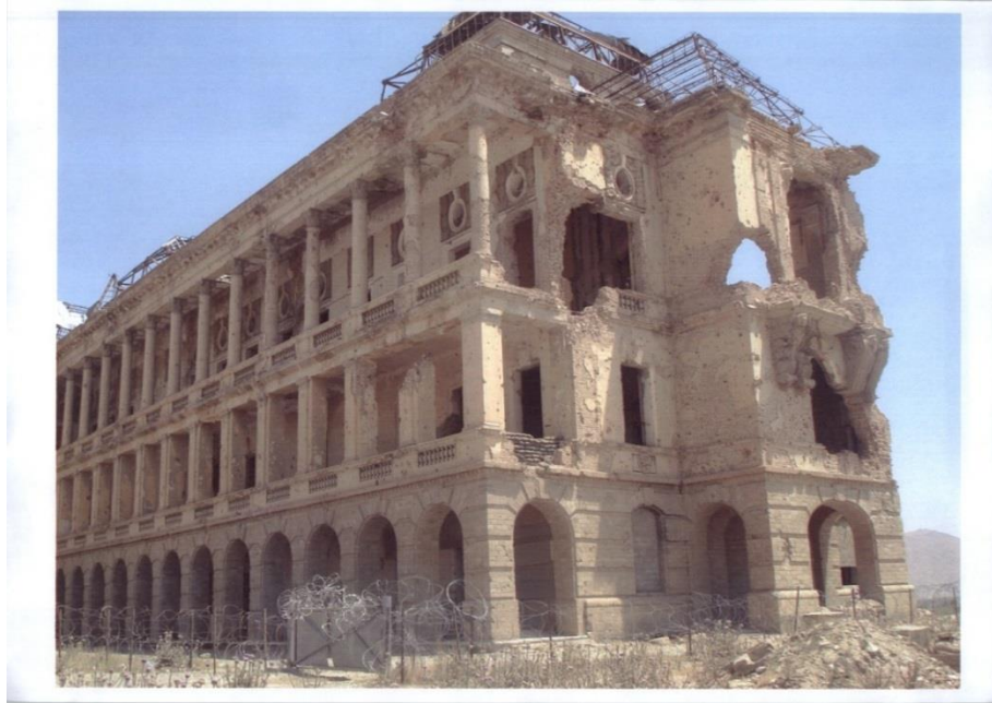
نمای جنوبی و غربی از خرابه های قصر تاریخی دارالامان