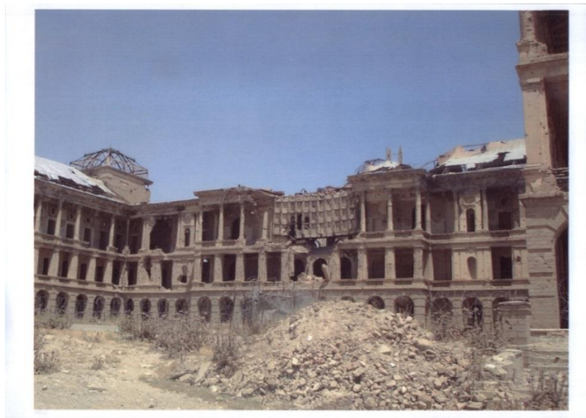
نمایی از حیاط (نمای جنوبی) خرابه های قصر تاریخی دارالامان