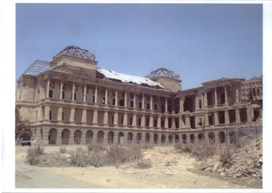
نمایی از حیاط (نمای شرقی و جنوبی) خرابه های قص تاریخی دارالامان