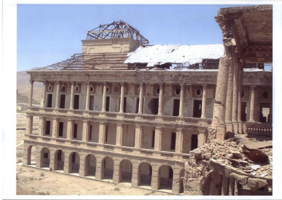
نمایی شرقی از خرابه های قصر تاریخی دارالامان