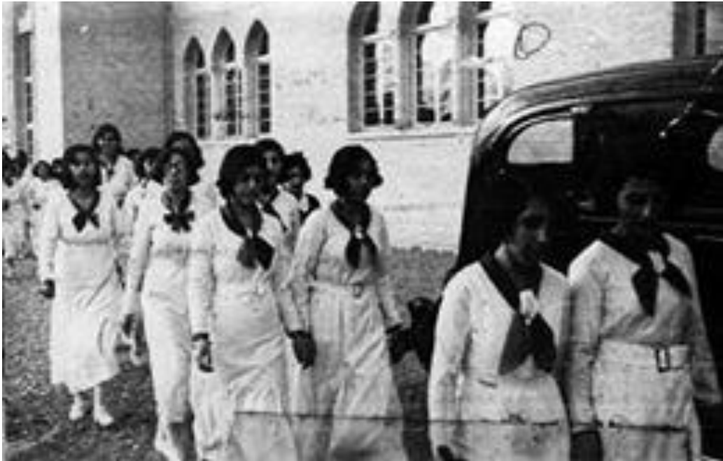
دختران افغان در روزهای اول اقامت در یکی از مکاتب دخترانه استانبول - اوایل 1928

اعزام دختران به ترکیه به سرعت مبدل به حربه تبلیغ قوی مخالفان دولت شد و مثل بمب انفجار کرد. یکماه از اعزام دختران به ترکیه نگذشته بود که آتش اغتشاش در وطن شعله ور شد و تبلیغات جدی علیه رژیم اوج گرفت که می گفتند: "پادشاه دختران مسلمان را به کافر ها میدهد و پسران را کافر شده بوطن برمیگرداند". (برای شرح مزید در این باره دیده شود: کتاب "زنان افغان زیر فشار عنعنه و تجدد"، تألیف: داکتر سیدعبدالله کاظم، چاپ کابل، نوامبر 2005، صفحه 156 - 162)