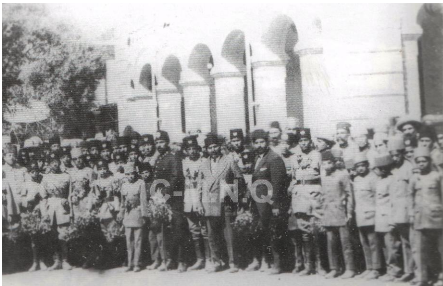
عکس دسته جمعی شاگردان افغانی که برای تحصیل روانه اروپا میباشند (سپتمبر 1921 - قصر ستور - کابل)

بر علاوه فراهم آوری زمینه های تحصیل برای نوجوانان افغان در داخل کشور، شاه امان الله تلاش کرد تا عده ای از پسران و دختران را جهت تحصیل به خارج کشور نیز اعزام دارد.