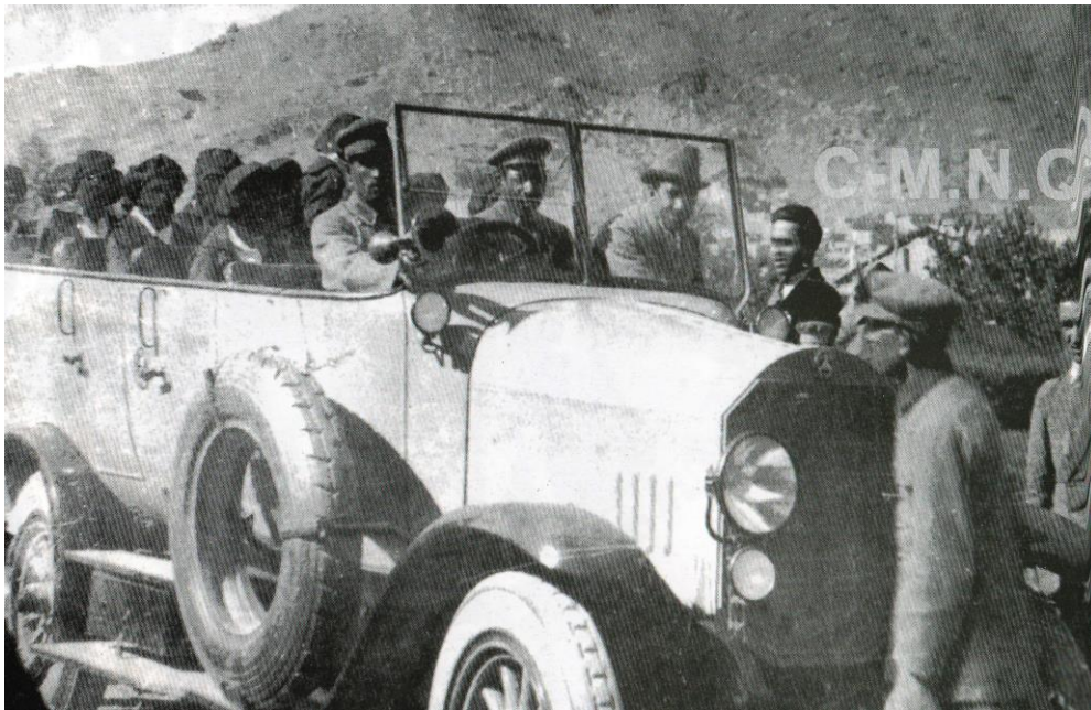
موتر حامل دختران در ادامه کاروان شاگردان بسوب ترکیه به راه افتادند. در روز حرکت شاگردان شاه امان الله و ملکه ثریا نیز جهت وداع تشریف آورده بودند