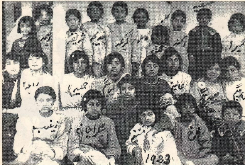
درین فوتو ۲۴ نفر از شاگردان مکتب مستورات در سال ۱۹۲۳ دیده میشوند. اینها خواهران ناسکه برادرزاده ها عموزاده ها و دختر امیرامان الله بودند ، به استثنای زینب (۷) ، همه نواسه هاوکواسه های امیر عبدالرحمن خان میباشند. سال تولدشان تخمینی است.

مکتب مستورات بیرون قصرشاهی در ناحیه "شهرآرا" در خانه علی احمدخان لویناب "بعداً والی" واقع بود که بیشتر شاگردان آنرا در سال اول (در حدود 50 نفر) دختران خاندان شاهی تشکیل می دادند. معلمه های اولی این مکتب آنعده خانم های بودند که در خانه سواد خواندن و نوشتن را آموخته و قدری از علم دینی و ادبی آگاهی داشتند.