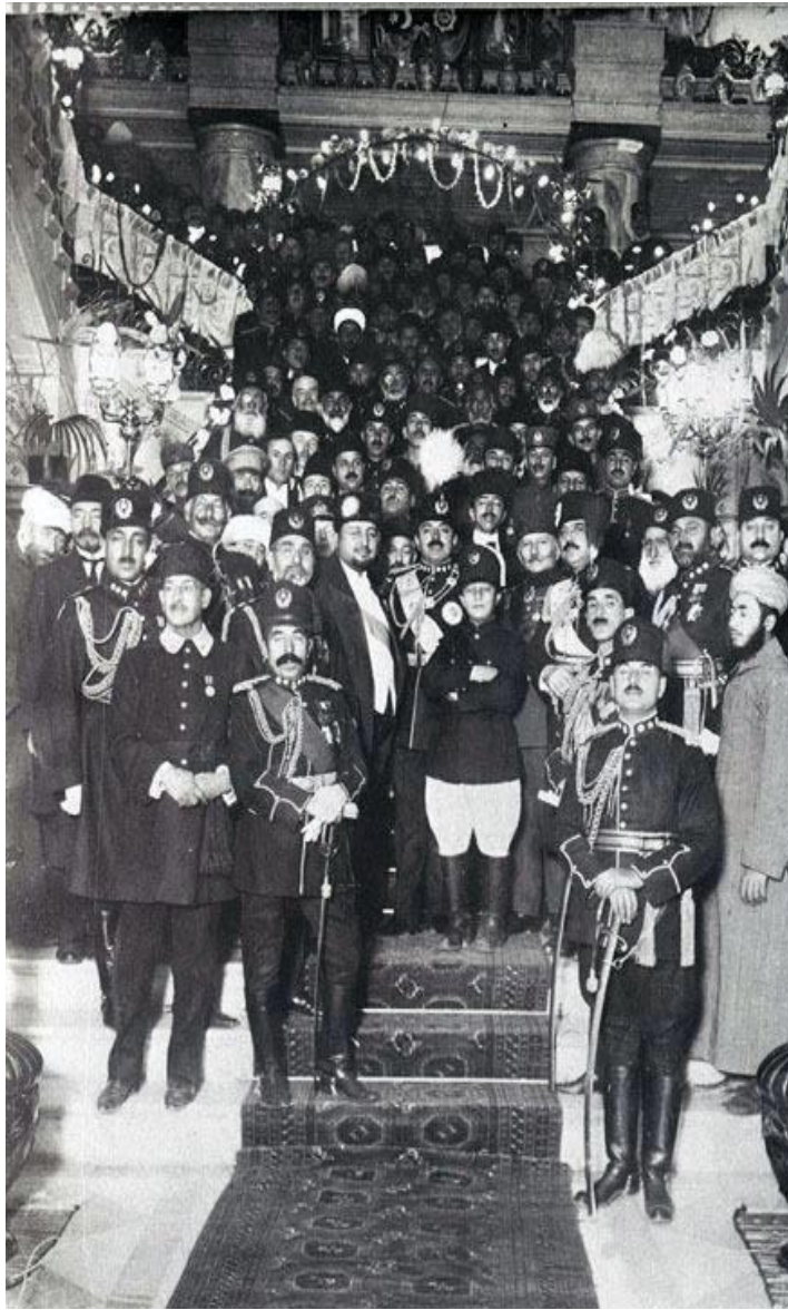
اعلیحضرت شاه امان الله غازی با عده ای از بزرگان و اراکین دولت در قصر دلکش (شروع سالهای 1920)

قبل از اینکه دربارهٔ مرانامه این حزب رسمی صحبت گردد، بيمورد نخواهد بود راجع به "کلوپ ستور" و نقش آن به حیث اولین کانون فرهنگی و سیاسی رسمی کشور که مرکز تجمع منظم یک تعداد نخبگان فرهنگی و سیاسی، بخصوص هواداران تغییر و تجدد و اکثر اراکین دولت در کابل بود، مختصر مطالبی بعرض برسد: قصر تاریخی "ستور" واقع در باغ ارگ کابل (فعلاً در داخل محوطه وزارت امور خارجه) که در سال 1298 شمسی باراول "ادارهٔ فاخرهٔ نظارت امور خارجه" تشکیل شد و بعداً در سال 1300 به حیث مقرمقام وزارت امور خارجه مسمی گردید، یکی از عمارات