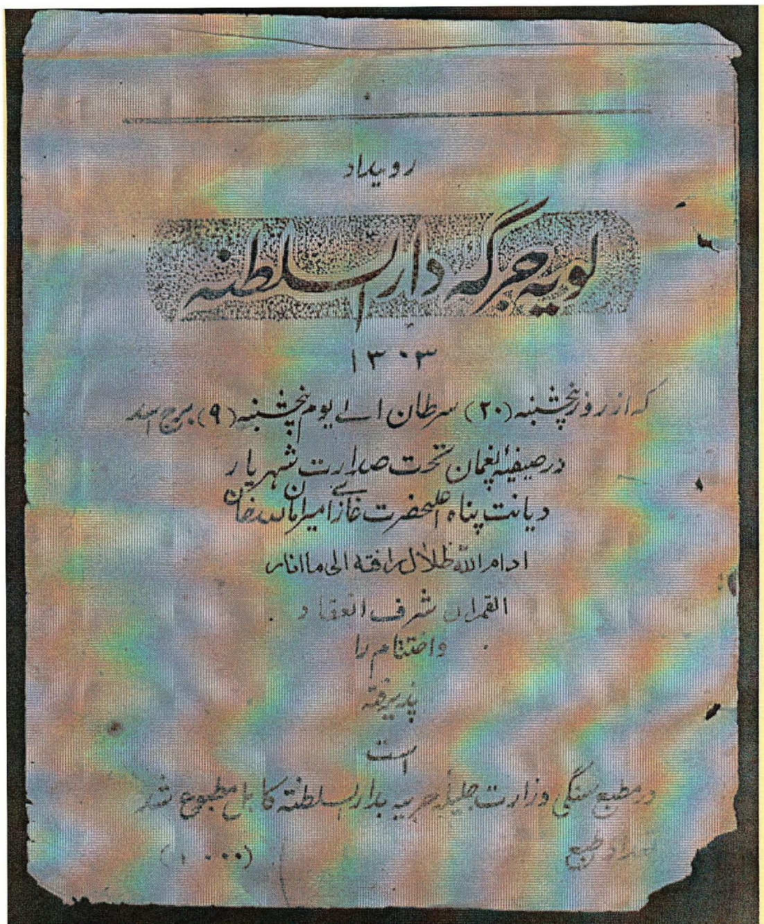
(تصویر پشتی کتاب)