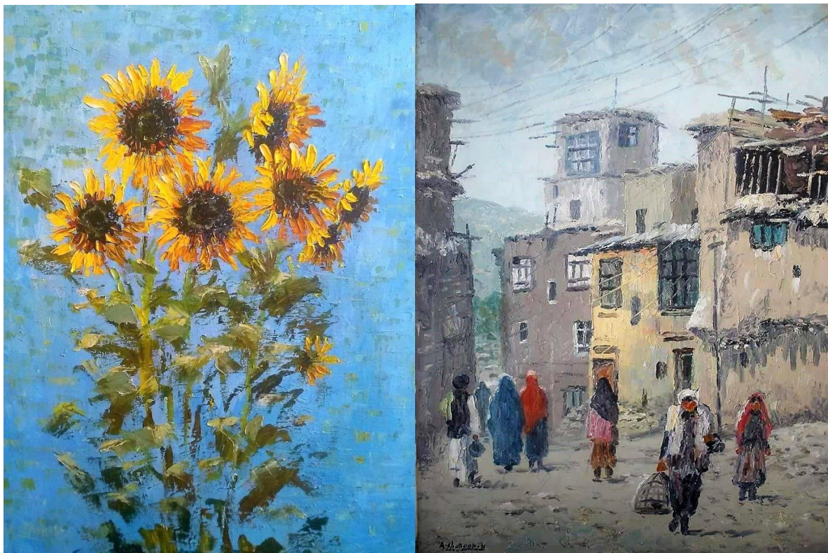
یک از خانه های قدیمی در شوربازار کابل که با رنگ روغنی بالای کنواس به سبک ریالیزم کار شده به اندازه 42×36 انچ؛ "گل آفتاب پرست" که به شیوه "بین ریالیزم و امپرسیونیسم" روی کنواس با کارد رسامی و رنگ روغنی کار شده و به اندازه 32×26 انچ است.

اینکه هدف اصلی از این تابلو در نظر خود هنرمند چه بوده است، نمیتوان آنرا تصویری از نظام کهکشان تعبیر کرد که در اطراف "حفره سیاه" یا "لایتناهی" (بلک هول) می چرخد. این تابلو به سبک ابسترکت به روی کنواس با رنگ اکریلیک به اندازه 18×12 کار شده است.