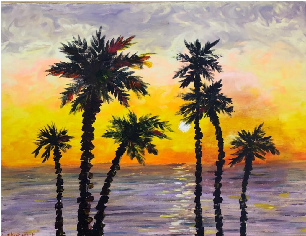
غروب در نخلستان که با روی کنواس با رنگ اکرولیک به اندازه 28×22 اینچ کار شده است