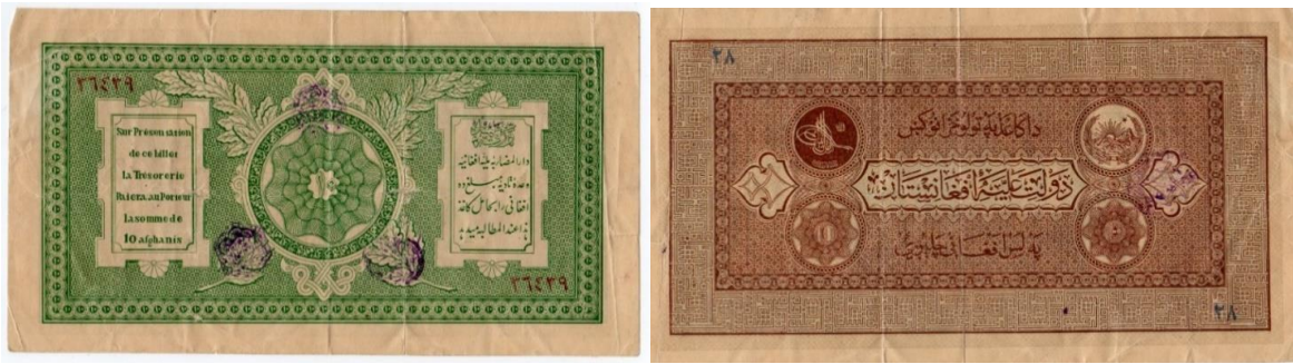
(روی و عقب نوت پنج و ده افغانیگی دوره امانی - با مهر دوره سقوی)

در اواخر دوره 9 ماهه امیر حبیب الله کلکانی که در اثر جنگهای دوامدار وضع مالی رژیم دچار بحران جدی شده بود و مردم نیز پول مسکوک نقره یعنی روپیه کابلی را به مقصد احتکار از دوران می کشیدند، رژیم سقوی برای تدارک پول کوشید از یکطرف نوتهای دوره امانی را پس از مهر مقامات ذیصلاح سقوی به دوران اندازد، چنانکه در نمونه نوتهای فوق مهرها دیده میشوند و ازطرف دیگر آنها با برگشت مجدد به "روپیه" به نشروپول کاغذی به آن اسم پرداختند، ولی اینکار موجب رفع مشکل نشد و قبل از آنکه این پول به چلند انداخته شود، رژیم سقوی سقوط کرد.