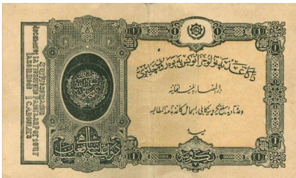
(نمونه نوت کاغذی روپیه دوره سقوی)

در اواخر دوره 9 ماهه امیر حبیب الله کلکانی که در اثر جنگهای دوامدار وضع مالی رژیم دچار بحران جدی شده بود و مردم نیز پول مسکوک نقره یعنی روپیه کابلی را به مقصد احتکار از دوران می کشیدند، رژیم سقوی برای تدارک پول کوشید از یکطرف نوتهای دوره امانی را پس از مهر مقامات ذیصلاح سقوی به دوران اندازد، چنانکه در نمونه نوتهای فوق مهرها دیده میشوند و ازطرف دیگر آنها با برگشت مجدد به "روپیه" به نشروپول کاغذی به آن اسم پرداختند، ولی اینکار موجب رفع مشکل نشد و قبل از آنکه این پول به چلند انداخته شود، رژیم سقوی سقوط کرد.