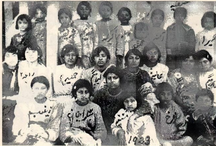
درین فوتو ۲۴ نفر از شاگردان مکتب مستورات در سال ۱۹۲۳ دیده میشوند. اینها خواهران ناسکه برادرزاده ها هموزاده ها و دختر امیرامان الله بودند ، به استثنای زینب (۷) ، همه نواسه ها و کواسه های امیر عبدالرحمن خان میباشند. سال تولدشان تخمینی است.