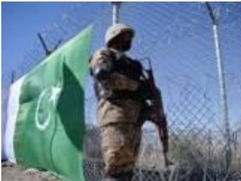
دیوار های اصلی خاردار در امتداد خط تحمیلی دیورند

مدت ها است که حکومت پاکستان با دستگاه های جهنمی اش، مشغول ساختن دیوار های در امتداد خط جعلی دیورند است، تا پشتون های دو منطقهء سرحدی را از هم جدا سازد.