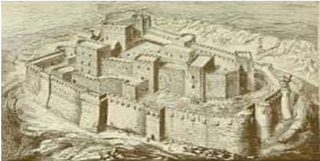
قلعه گرشک در ولایت هلمند

چیزی که قبل از رسیدن به گرشک نظر انسان را از فاصله دور بخود معطوف میکند، قلعه گرشک است که بر یک تپه نسبتاً مرتفع تر از سطح جلگه در سمت راست رودخانه هیلمند موقعیت دارد. و در نشیب این قلعه بازار و دوایردولتی قرار دارد.